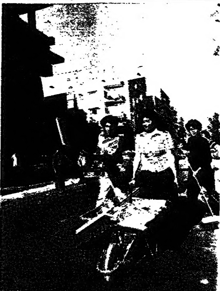
خلال الاحداث الاخيرة ، قامت صحيفة «التايمز» البريطانية ان الذين يرمون لبنان جيداً ، ويكثرونه سجنات المحلة . وبالفضل اجتاحها ، وبدأت الشوارع تشهد ، بدلا من الماتريس حبات تنظيف يشترك فيها شبان ونفيات . أما القذافي الذي كانت تطلق اللقطة ، فقد باتت تعاقب في الامتياز وحصول الخصم للزينة . واعلاء صور من بيروت تجمع بين الزينة والتنظيف .